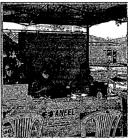
TENDA DE CADASTRAMENTO PARA A TROCA DE GELADEIRA EM ÁREA COMUNICADÉ QUILOMBOLA DE CAXIAS

Entre os serviços realizados, estão pintura interna e externa, instalação de calha pluvial, retelhamento, novas instalações elétricas, rodapés de alumínio, recuperação do piso de madeira, nova iluminação, novo forro de PVC, revisão das esquadrias, troca de janelas e fechaduras, instalação de corrimão nas escadas, além de poda e capina. A quadra poliesportiva da escola foi totalmente recuperada, recebendo nova pintura e rede de nylon alambrado. A unidade de ensino também foi totalmente climatizada com a instalação de ar-condicionado em todas as salas de aula e demais dependências.