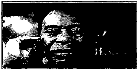
O REI DO FUTEBOL PASSOU POR UMA CIRURGIA NO INTESTINO