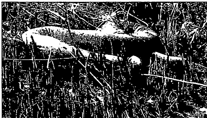
SUCURI CARBONIZADA APÓS QUEIMADA NO PANTANAL MATOGROSSENSE: TRAGÉDIA ECOLÓGICA

COBRAS, COMO A SUCURI, REPRESENTAM 60% DOS BICHOS CARBONIZADOS