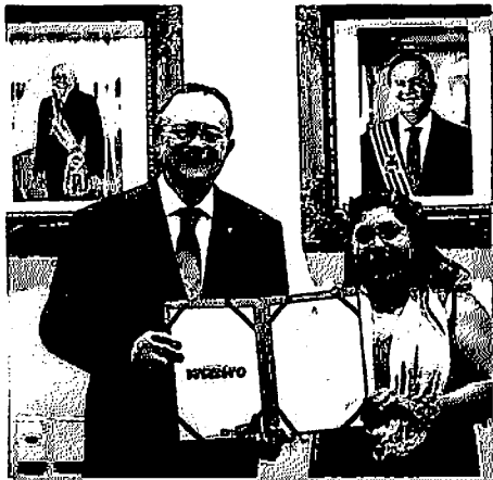
▶ MEDIDA PROVISÓRIA CRIA SECRETARIA ADJUNTA DE EDUCAÇÃO DOS POVOS INDÍGENAS VINCULADA À ESTRUTURA DA SECRETARIA DE ESTADO DA EDUCAÇÃO

Ainda de acordo com o documento, a Secretaria Ad-