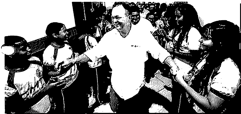
BRANDÃO MOSTRA SEU FIRME COMPROMISSO COM A EDUCAÇÃO NO MARANHÃO

Com essa iniciativa, o governo do Estado reafirma seu compromisso com a melhoria da qualidade da educação no Maranhão