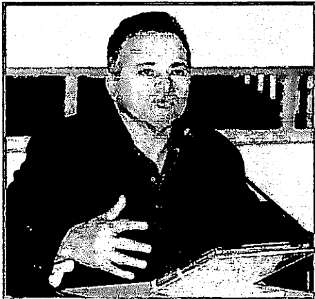
ISAAC ALCOLUMBRE É DONO DE UM AERÓDROMO USADO POR TRAFICANTES DA COLÔMBIA E DA VENEZUELA

A ação partiu de investigação no Amapá iniciada em maio de 2020 que identificou que o estado era um ponto logístico da