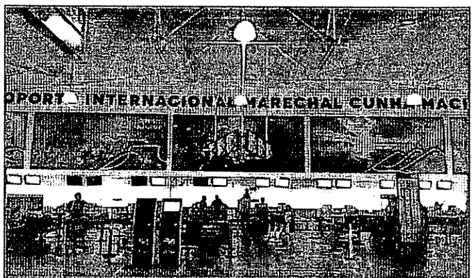
ADMINISTRAÇÃO DO AEROPORTO DE SÃO LUÍS ESTÁ AGORA NAS MÃOS DO GRUPO CCR

Promovido em abril na Bolsa de Valores de São Paulo, durante a Infra Week, o leilão