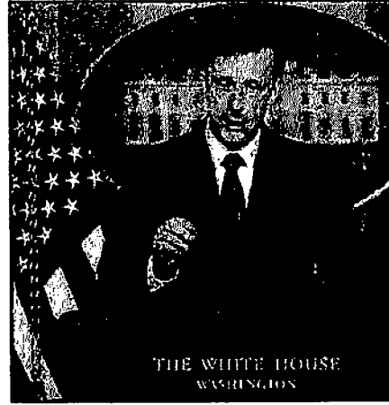
JAKE SULLIVAN: MUDANÇAS CLIMÁTICAS ESTARÃO NO CENTRO DAS CONVERSAS COM O PRESIDENTE E OS GOVERNADORES DA AMAZÔNIA

Uma alta autoridade do governo americano disse que os temas ambientais são uma prioridade para o presidente