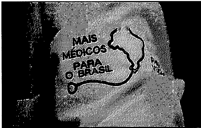
AO TODO, ESTÃO SENDO DISPONIBILIZADAS QUASE 6 MIL VAGAS EM TODO O BRASIL

INCENTIVOS PARA REGIÕES VULNERÁVEIS Em torno de 45% das vagas foram destinadas a regiões de vulnerabilidade, e 1.000 delas foram abertas para a Amazônia Legal. Médi-