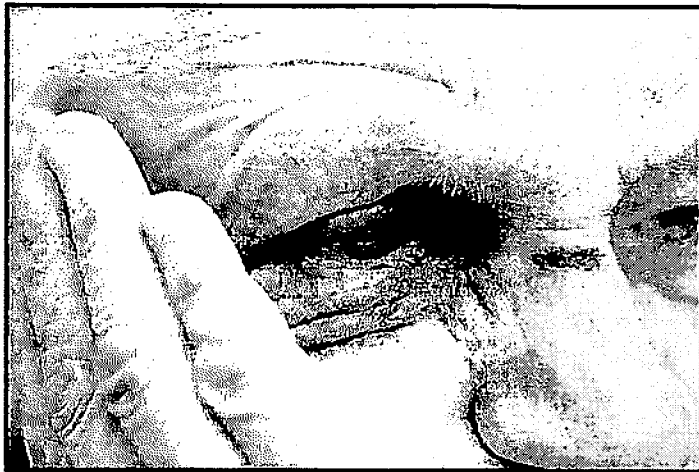
A VIOLÊNCIA CONTRA O IDOSO É CRIME PREVISTO EM LEI E PODER TER PENA DE DOIS MESES A UM ANO DE RECLUSÃO, ALÉM DE MULTA

Mesmo antes da pandemia, o Disque 100 — serviço que atende denúncias e reclamações que envolvem a violação dos Direitos