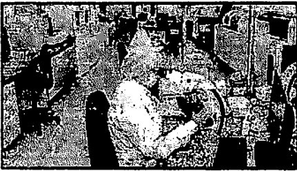
COM MODERNO PARQUE TECNOLÓGICO, O LACMAR FOI O PRIMEIRO LABORATÓRIO DO NORTE E NORDESTE DO PAÍS A SER COMPLETAMENTE AUTOMATIZADO.