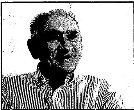
O EX-PREFEITOMORREU NA MADRUGADA DESTA TERÇA-FEIRA (12), POR COMPLICAÇÕES DA COVID-19

Logo depois, durante governo federal de José Sarney, Vicente Fialho foi ministro de Minas e Energia entre os anos de 1989 e 1990. O homem também exerceu mandato de deputado federal de 1991 a 1995.