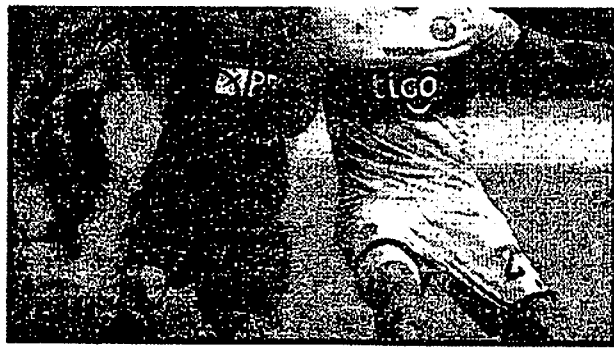
ISLA FICA FORA DO JOGO DE HOJE PELA LIBERTADORES

avando ue ar, o trio se 19 - René ente aos embarca sília, onde às 19h15 no estádio O time jogo por 4 se preferença ou