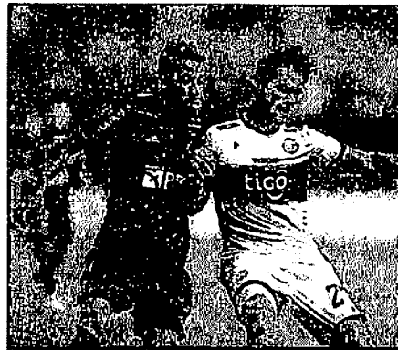
ISLA FICA FORA DO JOGO DE HOJE PELA LIBERTADORES

O Flamengo embarca nesta tarde para Brasília, onde enfrenta o Olímpia às 19h15 desta quarta-feira, no estádio Mané Garrincha. O time venceu o primeiro jogo por 4 a 1 e se classifica até se perder por dois gols de diferença ou 3 a 0.