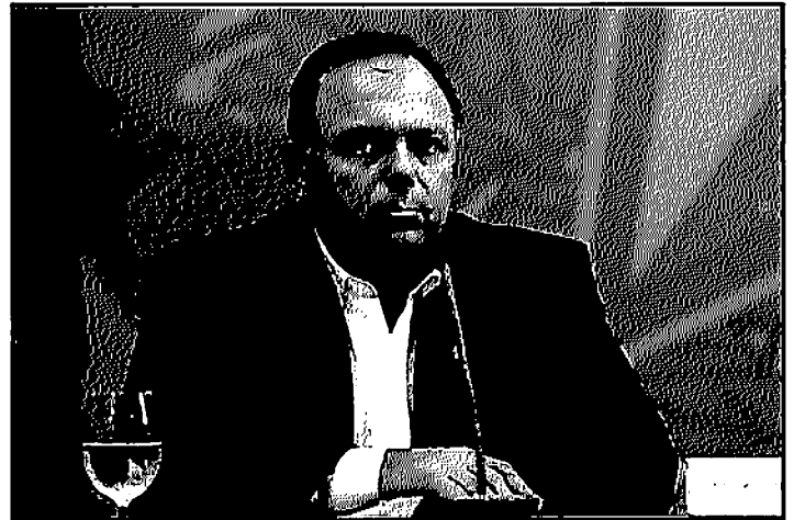
Ministro Eduardo Pazuello: doses devem chegar no Brasil no dia 16

De acordo com o ministro, ainda em janeiro, a partir de liberação da Agência Nacional de Vigilância Sanitária (Anvisa), o governo terá 8 milhões de doses para vacinar a