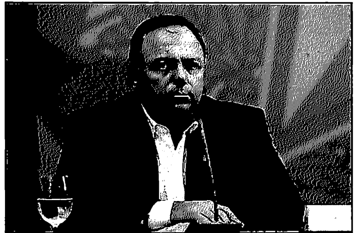
Ministro Eduardo Pazuello: as doses devem chegar no Brasil no dia 16

De acordo com o ministro, ainda em janeiro, a partir de liberação da Agência Nacional de Vigilância Sanitária (Anvisa), o governo terá 8 milhões de doses para vacinar a