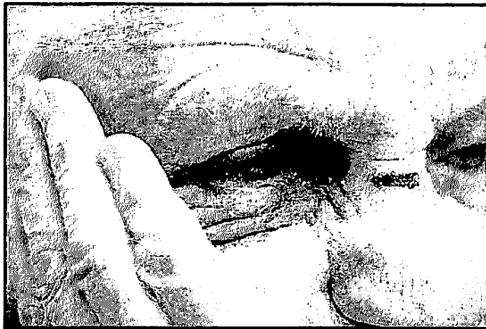
AVIOLÊNCIA CONTRA O IDOSO É CRIME PREVISTO EM LEI E PODE TER PENA DE DOIS MESES A UM ANO DE RECLUSÃO, ALÉM DE MULTA

Mesmo antes da pandemia, o Disque 100 — serviço que atende denúncias e reclamações que envolvem a violação dos Direitos