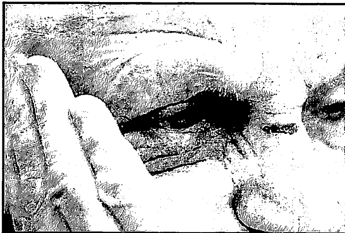
AVIOLÊNCIA CONTRA O IDOSO É CRIME PREVISTO EM LEI E PODE TER PENA DE DOIS MESES A UM ANO DE RECLUSÃO, ALÉM DE MULTA

Mesmo antes da pandemia, o Disque 100 — serviço que atende denúncias e reclamações que envolvem a violação dos Direitos