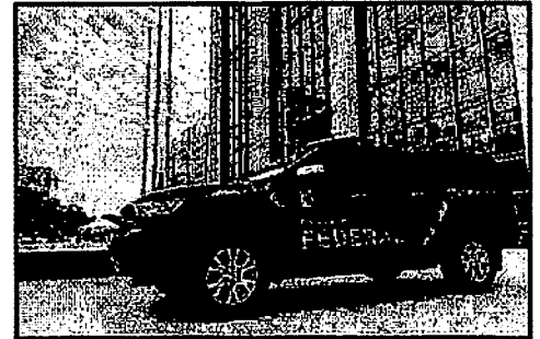
FRAUDES EM CONSÓRCIOS DO BANCO DO BRASIL FORAM ALVO DA FEDERAL

A PF afirmou que os suspeitos são investigados pelo crime de gestão fraudulenta, que tem pena de três a doze anos de prisão, além de multa.