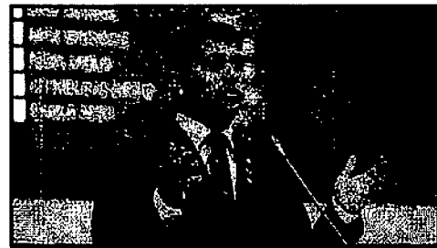
WELLINGTON DO CURSO PEGOU NO PÉ DE SINDICALISTAS COM SUPERSALÁRIOS

Ao mencionar o caso, Wellington destacou que inserir ou alterar e modificar dados públicos em sistema de informação pode caracterizar crime e afirmou que solicitará esclarecimentos da SEDUC e da Secretaria de Transparência e Controle acerca das alterações ocorridas no Portal da Transparência.