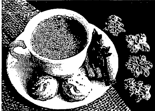
LUGARES QUE FAZEM A DIFERENÇA PARA UM CAFÉ E CLARO, UMA BOA CONVERSA

A segunda opção tem a sua localização na Ponta d'Árcia, sendo mais exata, no Ed. Península Mall & Offices. Funciona das 15h às 20h30, na segunda-feira e quarta, já nos outros dias, sempre das 14h30 às 22h. Entre os pe-