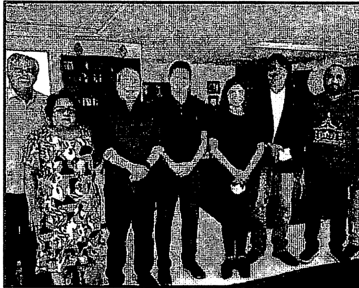
EMEBEBISTAS DECIDIRAM NA SEGUNDA QUE ROSEANA SERÁ CANDIDATA A GOVERNADORA