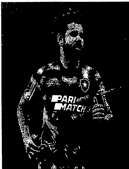
DIEGO COSTA FEZ O PRIMEIRO TREINO NO BOTAFOGO E DEPENDE DO BID PARA ESTREIA

A presença no jogo contra o São Paulo, às 16h do próximo sábado, - além, claro, da parte física - depende da questão burocrática. Diego Costa ainda não teve o nome publicado no BID da CBF, mas o Botafogo tem até sexta-feira para fazê-lo.