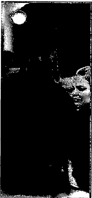
SUA CAMPANHA AO GOVERNO