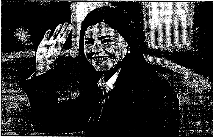
A "GUERREIRA" TA SENTINDO FALTA DAS "COISAS BOAS" DE VIVER NO "CURRAL" FEDERAL

Alguns integrantes do partido ainda tentavam convencer a emedebista a entrar na disputa majoritária para o governo com o intuito de fazer com que o seu grupo político voltasse à hegemonia no Maranhão. Porém, o MDB deve seguir com o apoio a Carlos Brandão (PSDB) para o governo do estado.