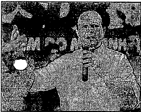
BRANDÃO QUER APOIO DO EX-PRESIDENTE, MAS SÓ DE LONGE

O vice-governador Carlos Brandão (PSDB) quer ter Lula (PT) em seu palanque, mas as diferenças ideológicas são tantas que ele é incapaz de pronunciar o nome do petista.